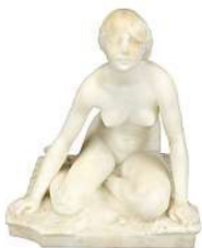
Per Hasselberg, Grodan, 1889