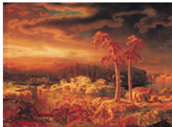
Marcus Larson, Vildmarkslandskap, 1861